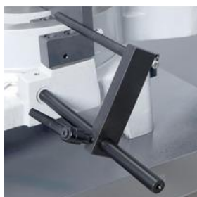
Упор для заготовок до 200 мм